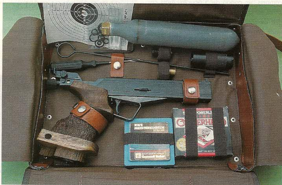
Le Drulov Condor est livré dans une sacoche en similicuir garnie de tous les accessoires nécessaires à son utilisation et à sa maintenance.