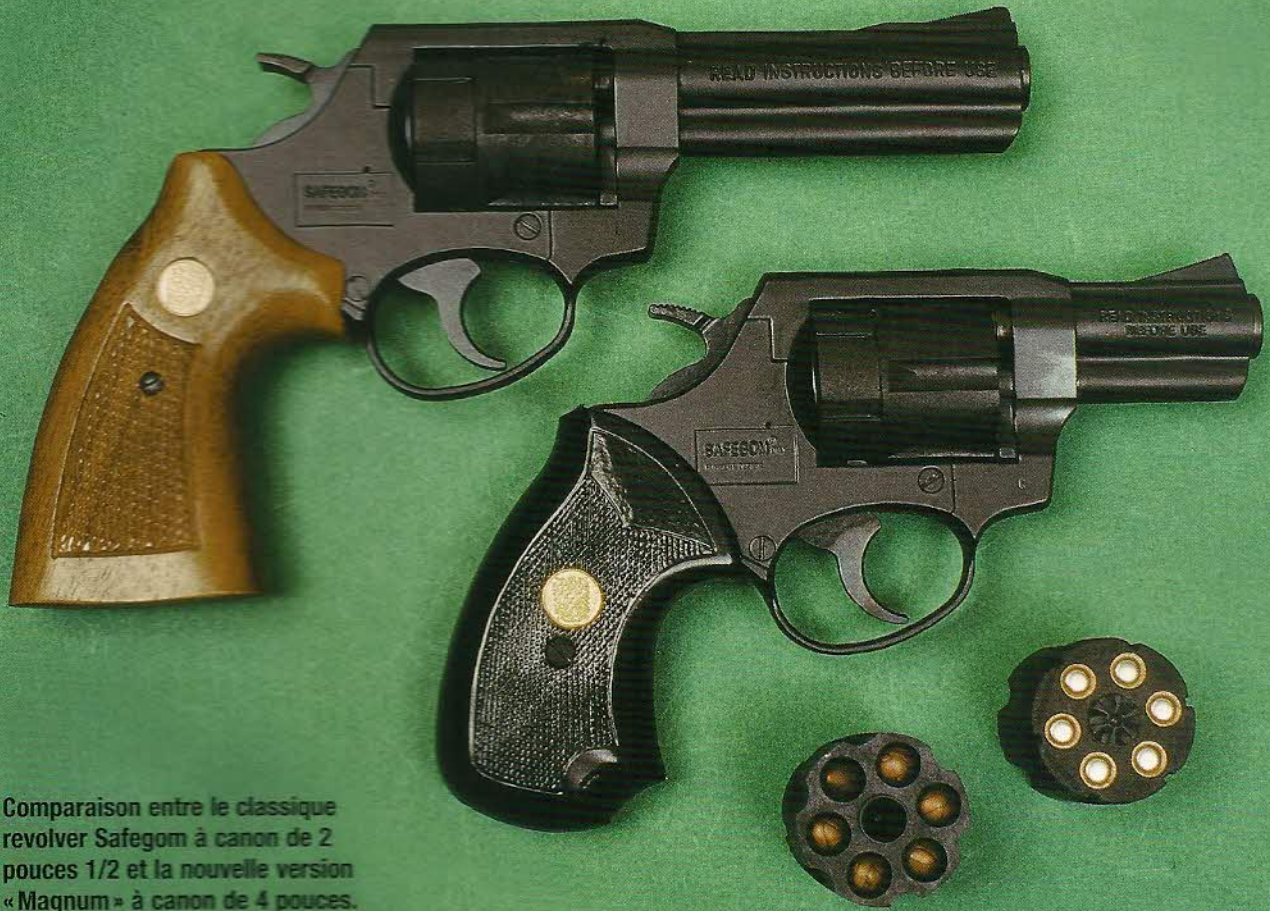
Comparaison entre le classique revolver Safegom à canon de 2 pouces 1/2 et la nouvelle version « Magnum » à canon de 4 pouces.

barillet, le chien, la détente, ainsi que certaines pièces du mécanisme sont en acier.